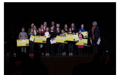
Preisträger des vierten Förderpreiswettbewerbs