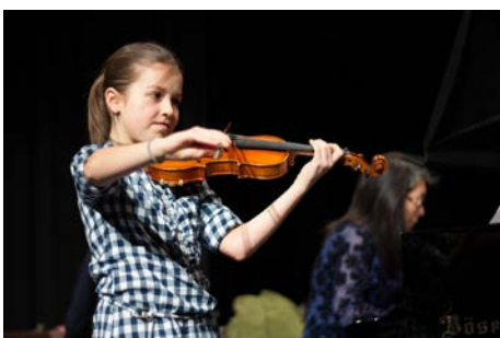
Volle Konzentration beim Preisträgerkonzert 2015 – sowohl bei den Solisten als auch den Ensembles

Das Besondere gleich vorweg: Beim Förderpreiswettbewerb zählt nicht die Leistung eines Tages, sondern die eines ganzen Jahres. Zusätzlich zur Leistung im Prüfungsspiel wird auch das Engagement der Schüler bei eigenen Auftritten, Konzertbesuchen und der Teilnahme an Wettbewerben bewertet.