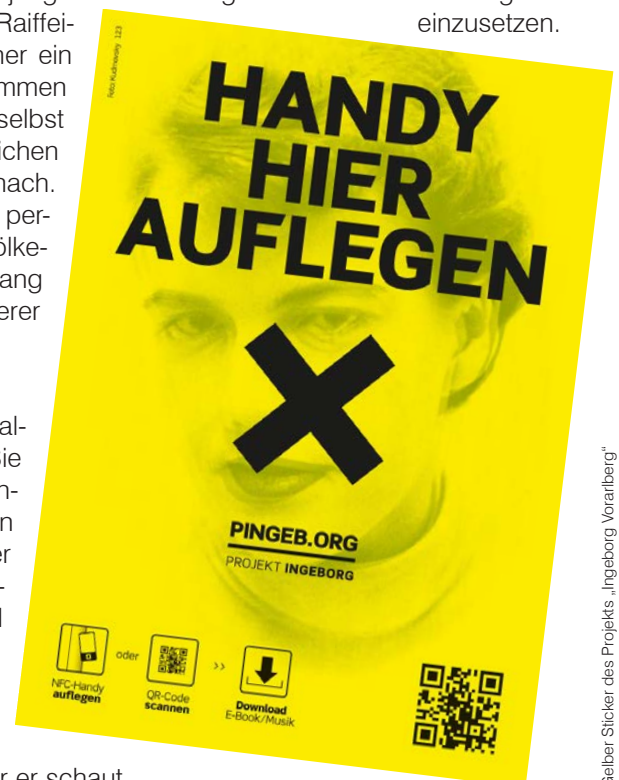
Gelber Sticker des Projekts „Ingeborg Vorarlberg“

Die gelben Sticker sind allerorts leicht zu finden: Sie kleben an den Scheiben unserer Bankstellen und an den Schaufenstern verschiedener Läden und Dienstleistungsbetriebe in Dornbirn und Lustenau. Wer es genau wissen will, besorgt sich am besten die kostenlose pingeb.org-App bei Google-Play oder im App Store. Oder er schaut