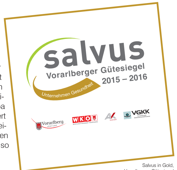
Salvus in Gold, Vorarlberger Gütesiegel